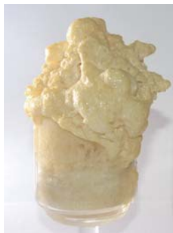
発泡した KÖSTER KP1