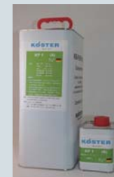
KÖSTER KP1 樹脂 5kg 触媒 0.5kg セット

コンクリート厚が 20cm の場合、長さ 20cm 程度のドリルビットが必要です。