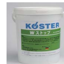
W ストップ 15kg, 6kg 缶入り